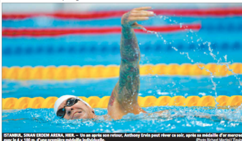
ISTANBUL, SINAN ERDEM ARENA. Hier. — Un an après son retour, Anthony Ervin peut rêver ce soir, après sa médaille d'or mercredi avec le 4 x 100 m, d'une première médaille individuelle.

Il y a un an, l'Américain, champion olympique du 50 m en 2000, retraité en 2003, replongeait. Avec succès. Il raconte.